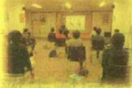
岐阜善光寺弘法堂

「認知症サポーター養成講座を受講したい」「認知症について学びたい」「サポーター活動を行いたい」などがありましたら、下記までご連絡下さい。