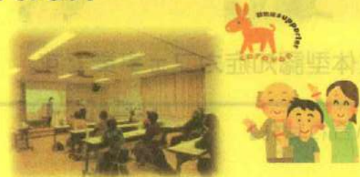
過去の養成講座の様子 1時間半程度の、無料の講座です。 ただし企業向けは、テキスト・送料代が別にかかります。