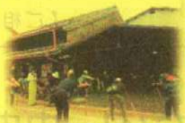
わいわいハウス金華