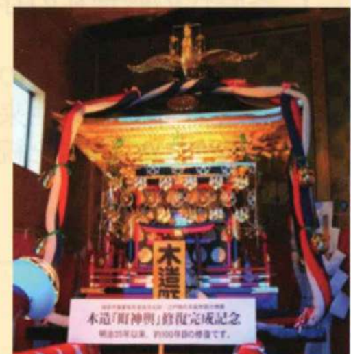
岐阜市重要有形民俗文化財指定