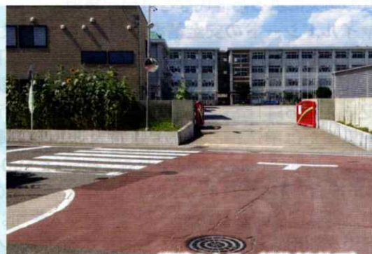
道路のカラー舗装(島地区)