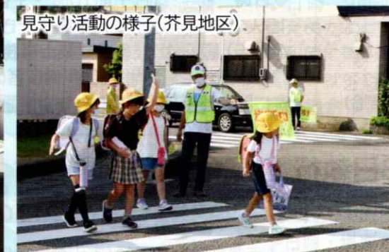
見守り活動の様子(芥見地区)