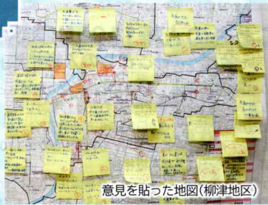
意見を貼った地図(柳津地区)