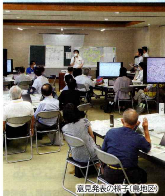
意見発表の様子(島地区)