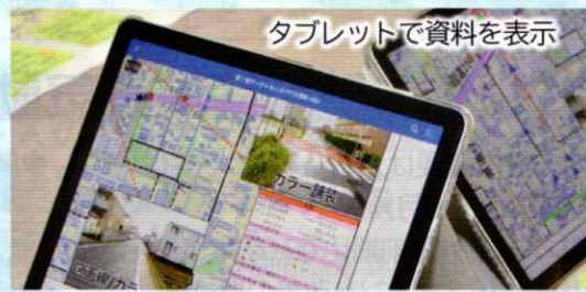
タブレットで資料を表示