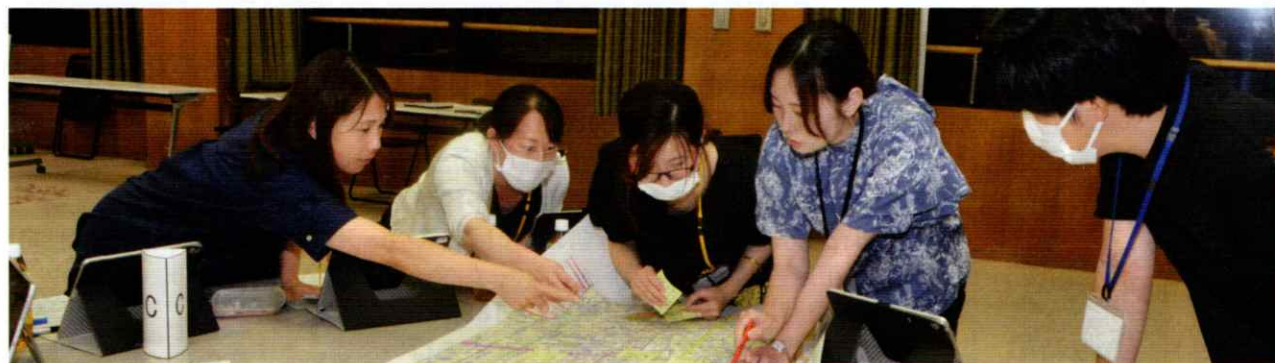
意見交換の様子(市橋地区)

岐阜市役所代表 ☎(058)265-4141 FAX(058)264-8602 〒500-8701 岐阜市司町40-1