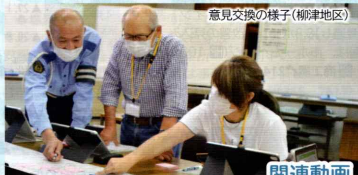
意見交換の様子(柳津地区)