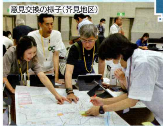
意見交換の様子(芥見地区)