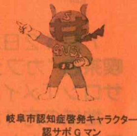
岐阜市認知症啓発キャラクター サポGマン

アルツハイマー病等に関する認識を高め、世界の患者と家族に援助と希望をもたらすことを目的とし、様々な取り組みを行っています。