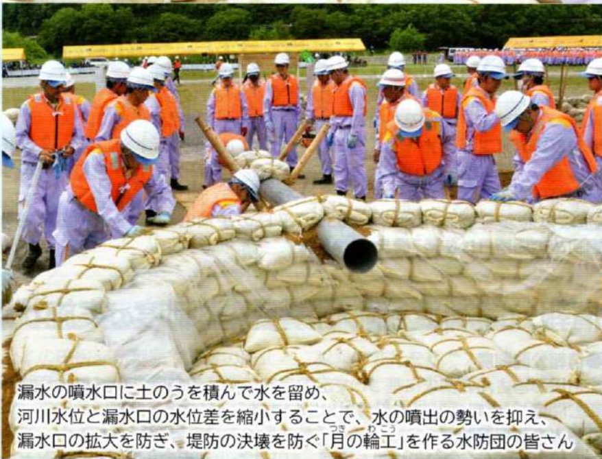
漏水の噴水口に土のうを積んで水を留め、河川水位と漏水口の水位差を縮小することで、水の噴出の勢いを抑え、漏水口の拡大を防ぎ、堤防の決壊を防ぐ「月の輪工」を作る水防団の皆さん