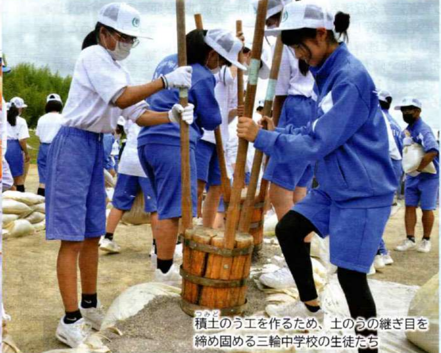
つみど 積土のう工を作るため、土のうの継ぎ目を締め固める三輪中学校の生徒たち