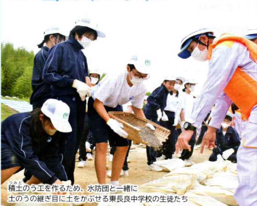
つみど 積土のう工を作るため、水防団と一緒に土のうの継ぎ目に土をかぶせる東長良中学校の生徒たち