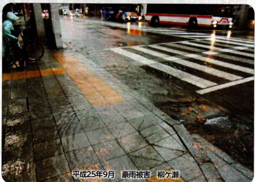
平成25年9月 豪雨被害 柳ヶ瀬