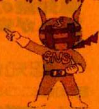
岐阜市認知症啓発キャラクター 認知サポGマン

アルツハイマー病等に関する認識を高め、世界の患者と家族に援助と希望をもたらすことを目的とし、様々な取り組みを行っています。