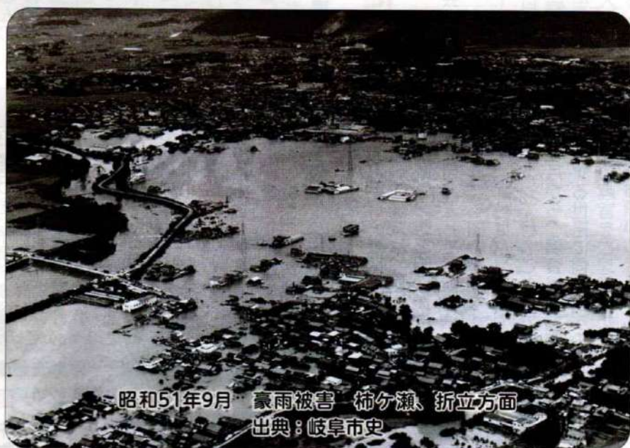
昭和51年9月 豪雨被害 柿ヶ瀬、折立方面