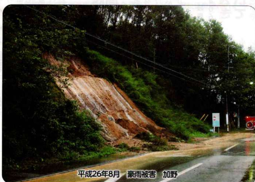
平成26年8月 豪雨被害 加野