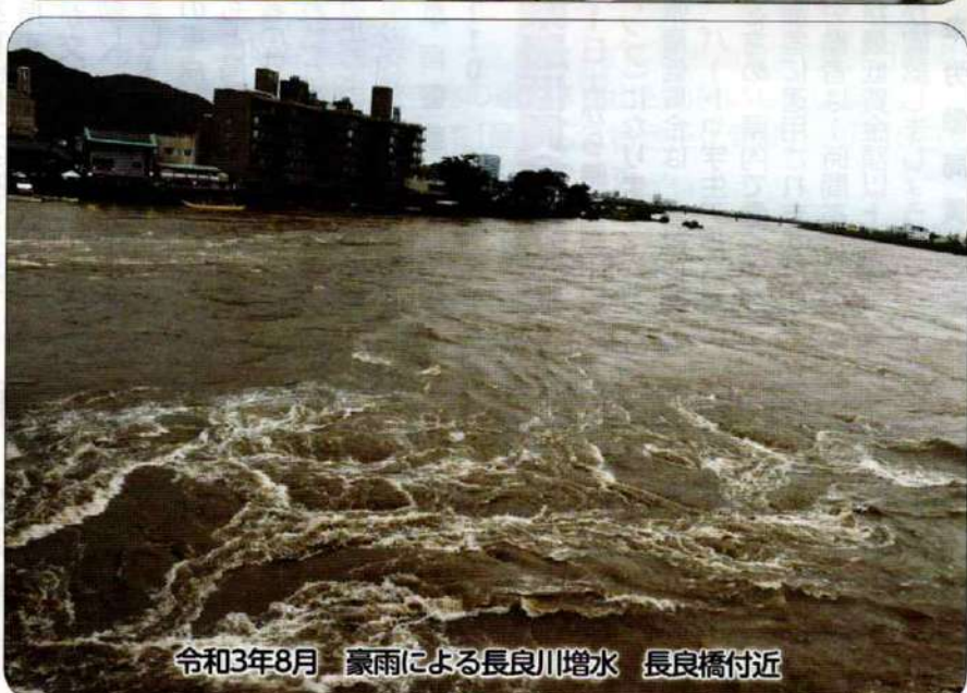
令和3年8月 豪雨による長良川増水 長良橋付近

集中豪雨や地震などの自然災害は突然発生します。ご家庭での災害の備えを見直し、いざというときの行動を家族で話し合ってみませんか。一人一人が災害リスクを想定し、災害時の避難における最適な選択ができるよう平時より準備をすることで、リスクを低減することができます。☎ 都市防災政策課 ☎267-4763 [関連記事] 8～9面に掲載