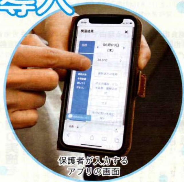
保護者が入力する アプリの画面

市立小・中学校、特別支援学校、幼稚園では、学校と保護者間の欠席連絡や検温報告、お便りの配布がスマートフォンでできる「スマート連絡帳」を6月から導入しました。これまで電話や紙で行われてきた学校と保護者間の連絡をデジタル化し、保護者の利便性向上と学校の朝の繁忙など負担軽減を図る取り組みです。教育現場におけるデジタル化が進んでいます。☎ 学校指導課GIGAスクール推進室 ☎214-2193 | 関連記事 | 4面に掲載