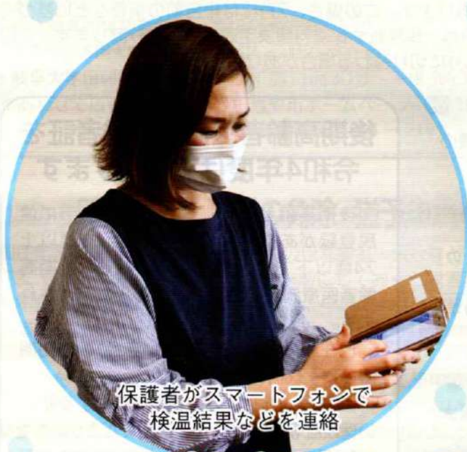
保護者がスマートフォンで 検温結果などを連絡