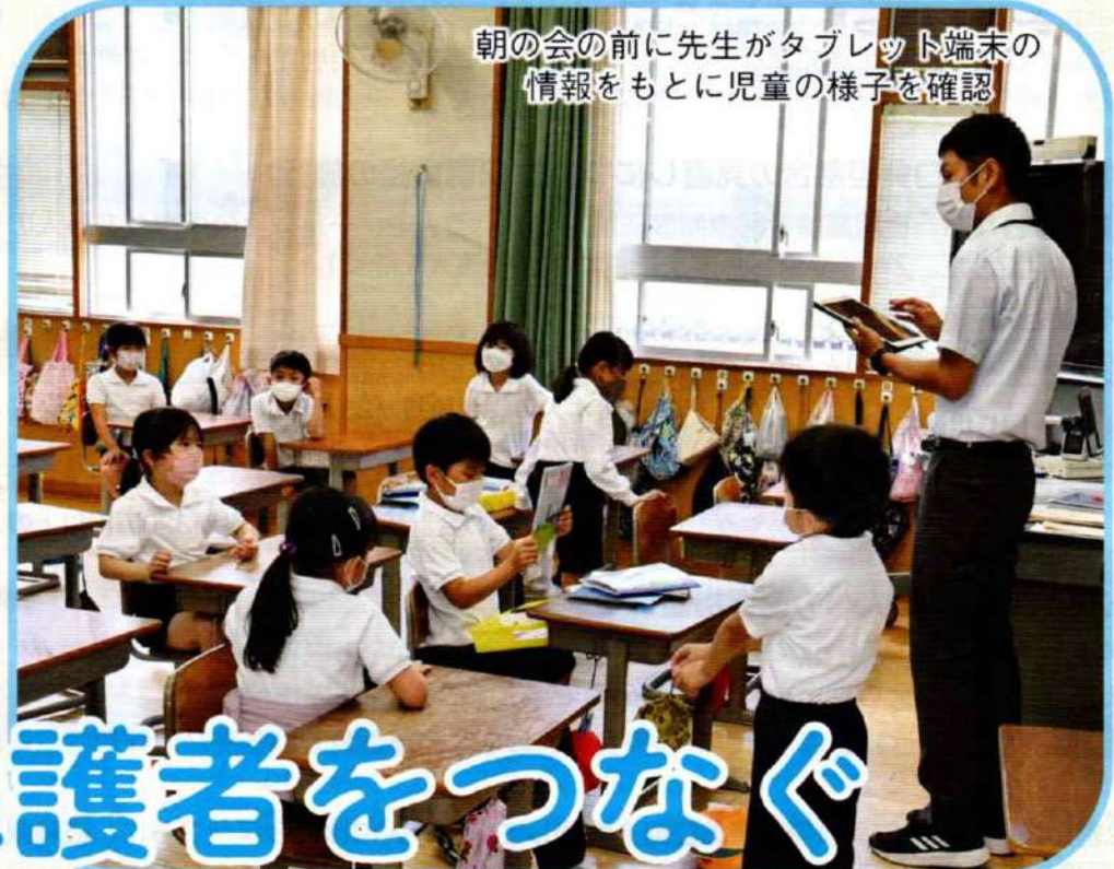
朝の会の前に先生がタブレット端末の 情報をもとに児童の様子を確認