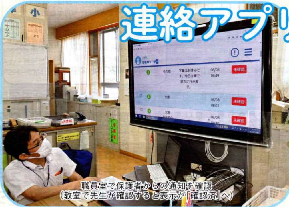
職員室で保護者からの通知を確認 (教室で先生が確認すると表示が「確認済」へ)