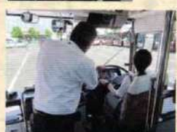
運転手採用セミナー