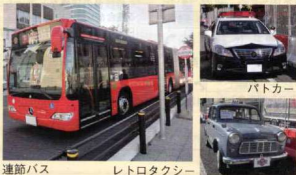
連節バス レトロタクシー