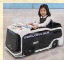
子ども専用燃料電池バス「SORA」