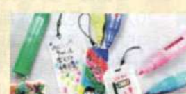
My リフレクター 反射板作成教室