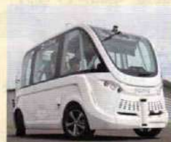
自動運転バス ※車内をご覧いただけます