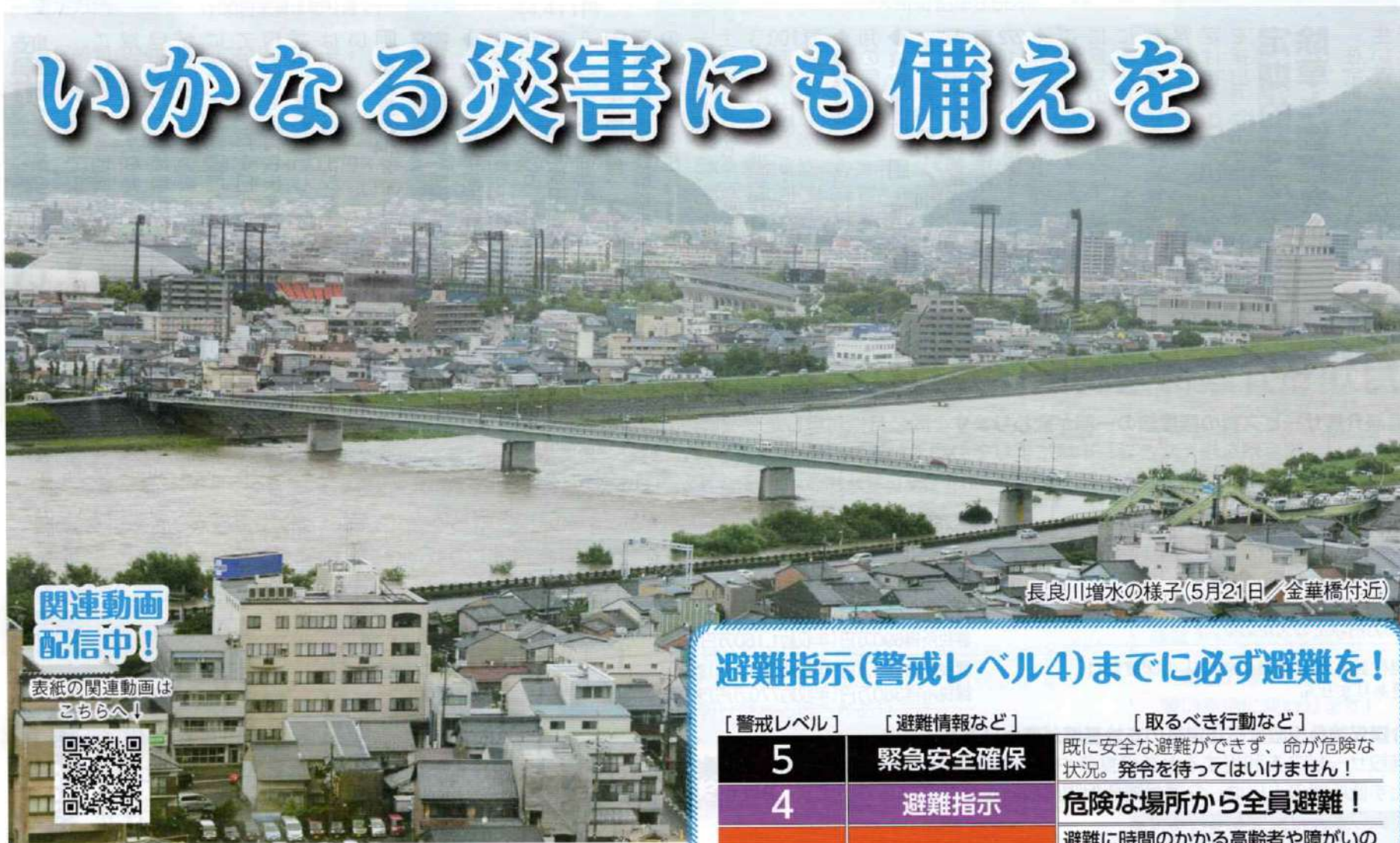
長良川増水の様子(5月21日/金華橋付近)