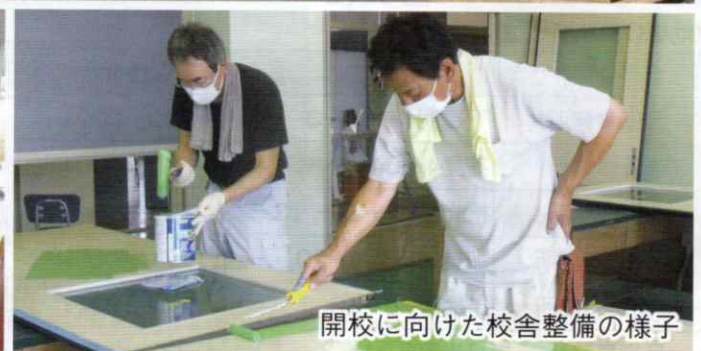
開校に向けた校舎整備の様子

4月開校の「市立草潤中学校」は、東海地区で初めての公立の不登校特例校です。地域の人や学校校務員などの協力により、開校までの準備が進められてきました。学校では、「ありのままの君を受け入れる新たな形」をコンセプトに、生徒の実態に配慮した特別の教育課程を編成し、少人数指導で個に応じた学習・体験ができる、特色ある教育を行っていきます。☎ 学校指導課 ☎214-2193 [関連記事]6面に掲載