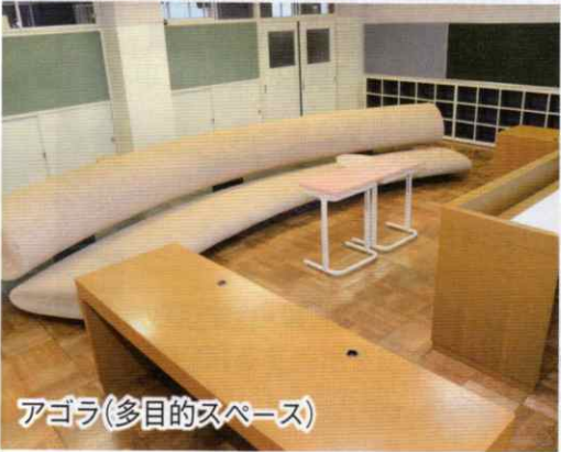
アゴラ(多目的スペース)