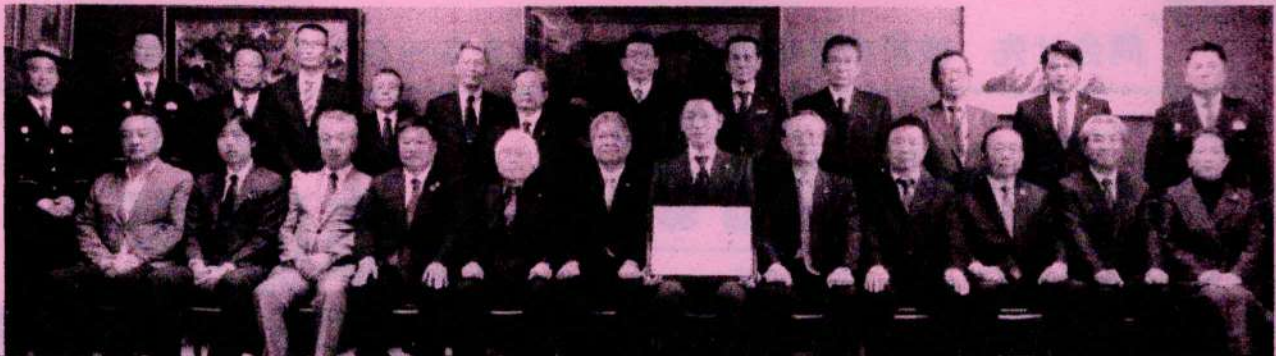
(市長応接室にて、感謝状贈呈式)

昨年末に発足した当協議会ですが、さまざまな業種業態企業の皆様のご賛同のもと、早速3台の防犯カメラを設置することができ、大変嬉しいです。今後も、岐阜市、各警察署、企業等と連携し、安全安心な地域づくりを実現していきたいです。