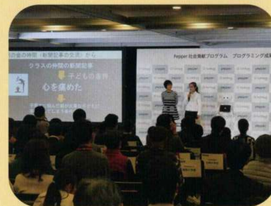
<Pepper 全国大会「金賞」受賞 「社会問題」に目を向け、挑む！>

思い起こせば、私が小学生の頃、自動車修理工場でスーパーカーに乗せられたおじさん、飼っているハムスターを見せてくれたおばさん、庭の木の実を食べさせてくれたおばあさん、雨の日に傘を貸してくれたおじいさん・・・その頃の大人たちは、きっと今の私と同じような気持ちで私たち子どもを見ていたのでしょう。