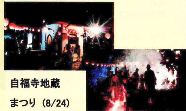
自福寺地蔵 まつり (8/24)

松山町や夕陽丘や金華の子供さんや家族の方も参加して、和尚のお話とみんなで花火を楽しみ夏の風情を味わいました。