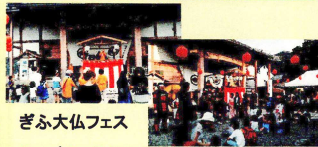
ぎふ大仏フェス ティバル (7/23・24)

天気にも恵まれ二日間とも大盛況。地元自治会や婦人会や子供会や赤十字奉仕団や金華消防団の協力の下実施された。盆踊りも何とも風情がありよかったですよ。