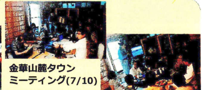
金華山麓タウン ミーティング(7/10)

天気にも恵まれ二日間とも大盛況。地元自治会や婦人会や子供会や赤十字奉仕団や金華消防団の協力の下実施された。盆踊りも何とも風情がありよかったですよ。